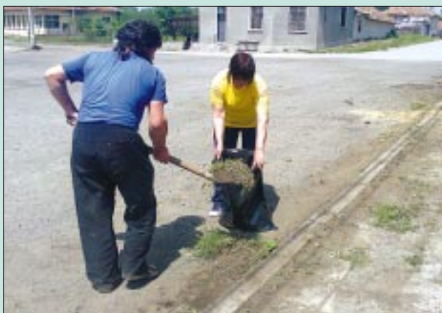
Момент от почистването на тротоарите в село Светлина

Село Светлина бе едно от селата, включило се в кампанията „Да