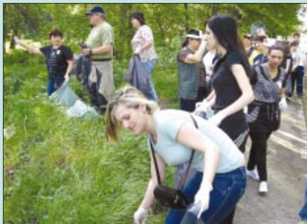
Десетки жители на Средец се включиха в кампанията „Да изчистим България за един ден“. Доброволците бяха раз-