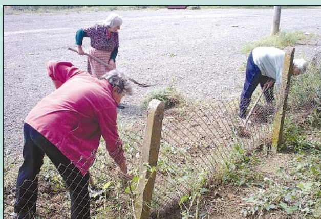
Част от малкото на брой жители в с. Белила също се включиха в кампанията

В групата доброволци участие взеха общинското ръководство на Средец, общинските съветници, служителите на общинска администрация и много граждани.