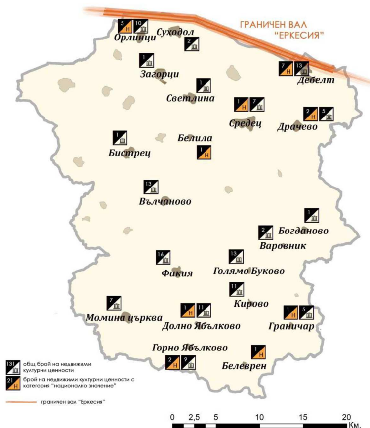
Фигура 2. Концентрация на недвижими културни ценности в община Средец